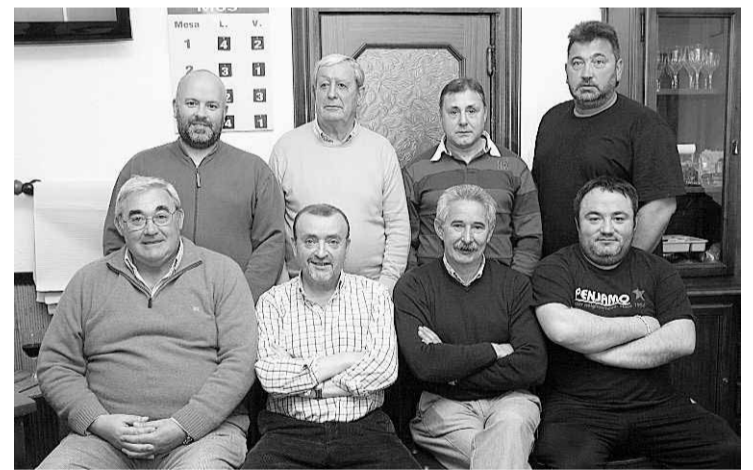
Los integrantes de Mirasol, el conjunto vencedor.

Va el domingo al Pico Morronegro con salida y llegada en Torrestío. Salida: 8.45 h. c/Uría, Oviedo) y 9 h., plaza San Miguel. MÁS INFORMACIÓN: 985 25 45 92 y www.gmmonsacro.blogspot.com